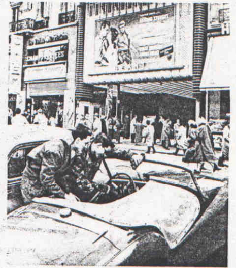
Une voiture sport, l'affiche du film : double symbole.

quitta Hollywood pour Salinas. Il devait disputer une course automobile ouverte indistinctement aux amateurs et aux professionnels. On sait que courir était devenu une passion dévorante dans sa vie, passion que la fameuse course de « poules mouillées » dans le film La Fureur de vivre avait suscitée, mais qu'un secret intime expliquait peut-être. Cela, on ne devait l'apprendre que plus tard. Mais voici les ultimes séquences du film tragique qui enregistra sa fin.