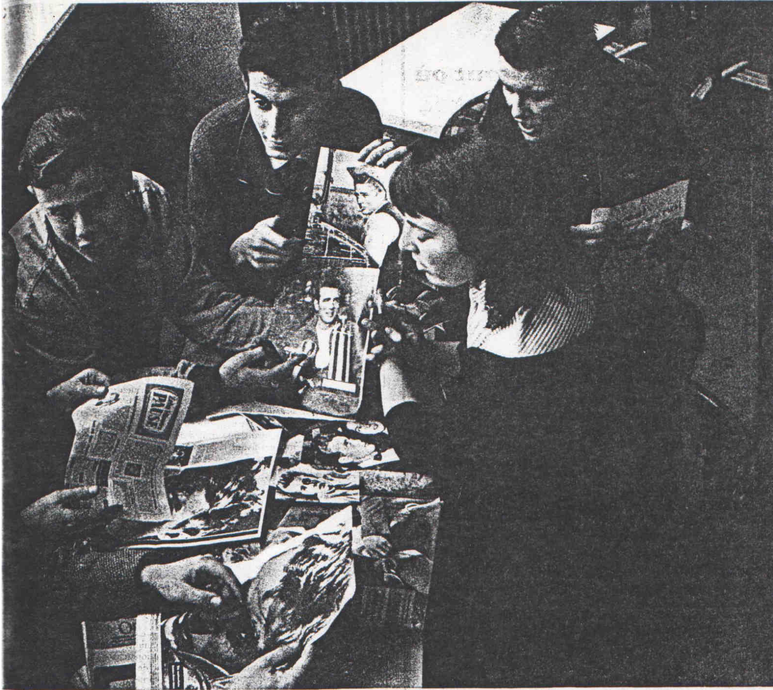
Strasbourg que se réunit le premier club français James Dean. En blue-jeans, devant les photos de « Jimmy », ses adorateurs répètent une pièce : L'Amour, toujours l'amour.

Dans l'arrière-salle d'un café des Boulevards, des jeunes gens qui ressemblent tous à leur idole. Sur les Champs-Élysées des spectateurs fanatiques du jeune dieu de l'écran mort à 180 à l'heure.