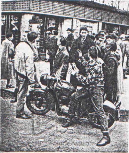
La moto, passion de l'idole, passionne aussi ses fans.