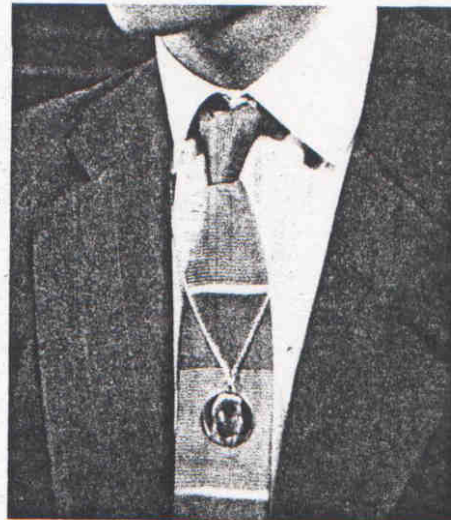
La médaille. Elle vient des Etats-Unis et coûte 360 fr.