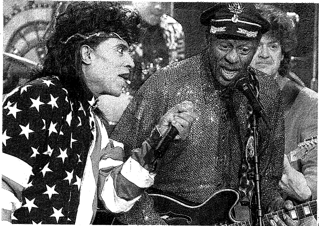
Bobital accueille, le samedi 8 juillet, trois légendes du rock n'roll sur la même scène : Jerry Lee Lewis, Little Richard et Chuck Berry. Des artistes à l'ego surdimensionné. Sur notre photo : Chuck Berry et Little Richard.

Chuck Berry, connu pour son légendaire Johnny Bee Good , n'est pas mal non plus dans son genre : « Il a demandé une Mercedes 500 toute neuve sans chauffeur. Il préfère la conduire seul. Il veut aussi, pour son fils, une BMW Série 5. Pour l'hébergement, on lui a trouvé un manoir avec, pour lui, une chambre avec deux lits, car il ne veut pas dormir avec sa compagne. Chuck Berry nous a aussi réclamé des amplis Fender dual qui ne se fabriquent plus depuis les années 80. Il en existe une petite dizaine en France. On a finale-